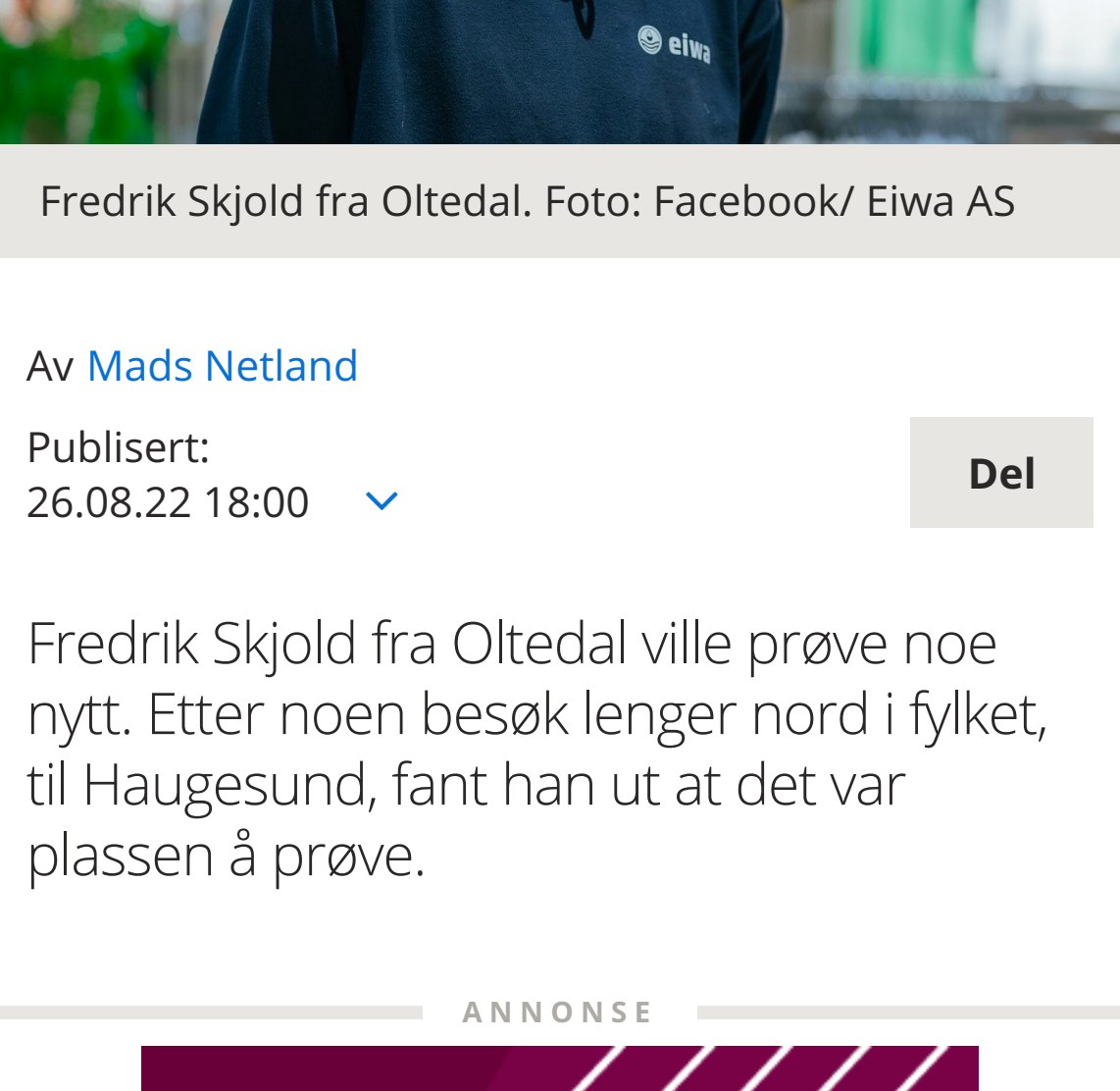
Fredrik Skjold fra Oltedal.